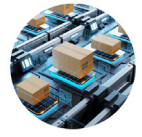
MIS & POM Journals